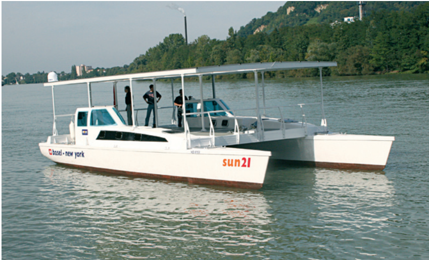
Catamaran Aquabus C60 Typ sun21